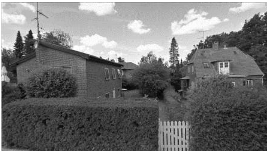
Emils hus på Harespringet 2 og Bents hus på Mosebakken 2 som det så ud 2010