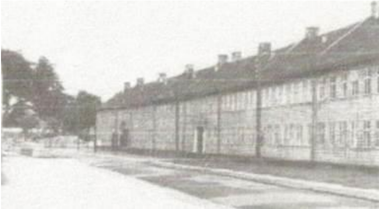
Husvildebarakken på Klitmøllervej hvor familien boede kortvarigt i 1926