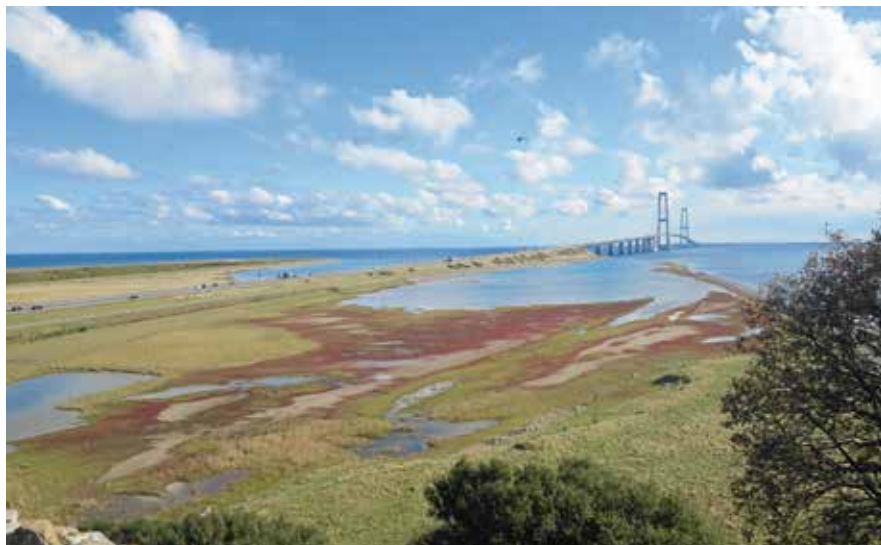
Sprogø anno 2013 (foto: Erik Lausen).

Det forlyder, at Christian II skulle have overladt det den gang ubeboede Sprogø til nogle hollændere. Disse flyttede senere til Bøtø, som var opdyrket af flere hollandske kolonister. 28 I 1569 fik en vis Niels Boesen af kongen lov til at bygge og bo på Sprogø. Der findes ikke mere om ham, men nav-