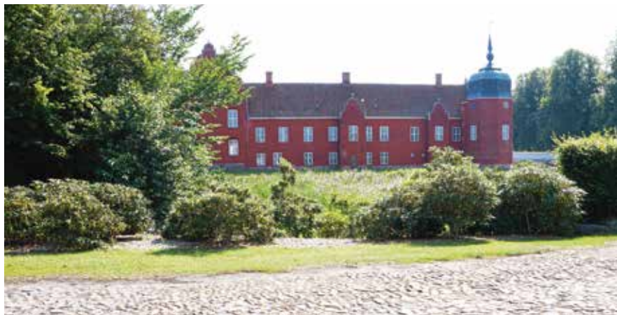
Løvenborg (foto: Inge-Lis Madsen, 2015).