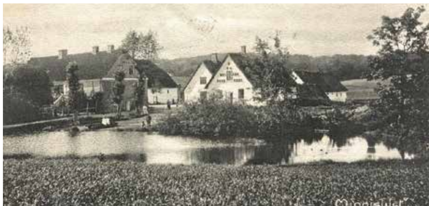
Mineslyst / Minnislyst, Tølløsevej 294, omkring 1910 (postkort, Tølløse Lokalkiv).

foråret 1789 til et bæst her og der. Der var skab blandt hestene, og nogle måtte slås ned, men det nytter ikke at gå foråret i møde med for ringe hestebestand. 'Hvorledes skal markarbejdet da blive gennemført?' skriver han.