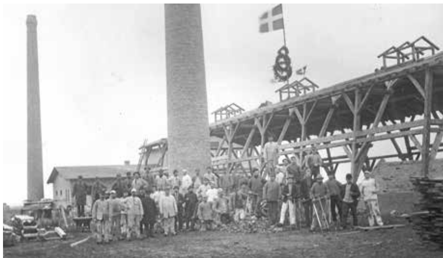
Arbejdere foran Tølløse Teglværk ved rejsegildet marts 1897 (Tølløse Lokalkiv).

de stige trin af jern, således, at når skorstenen er færdig, er der trin fra jorden til skorstenens top.