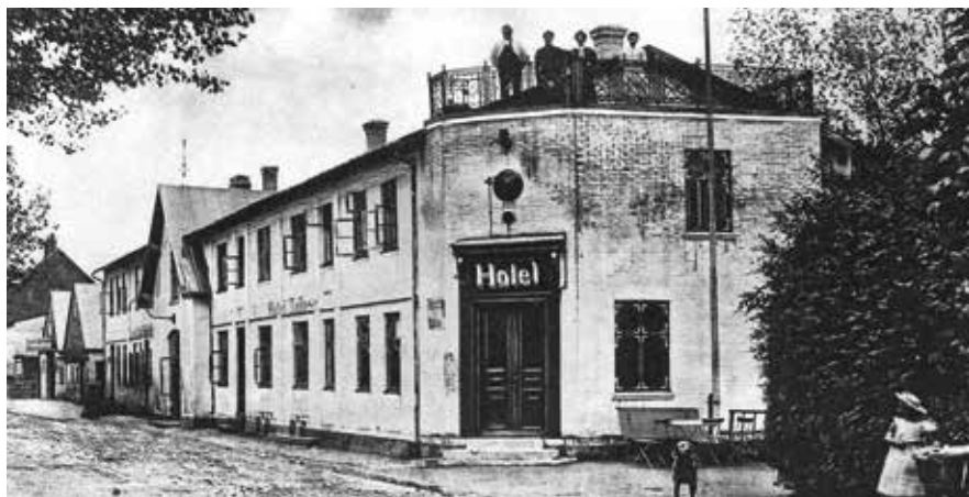
Hotel Håbet / Tølløse Hotel på Jernbanevej omkr. 1907.