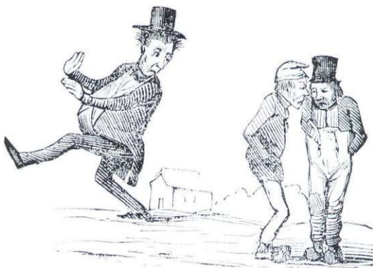
Holbæks amtmand, der ser to husmænd hviske sammen