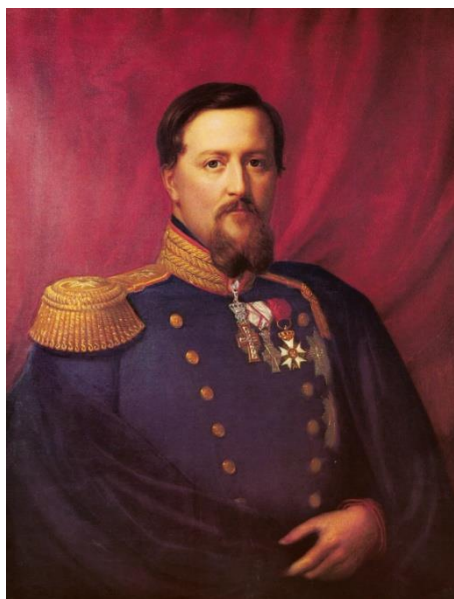
Frederik d. 7.

der var handlekraftigt. Det blev en konservativ-liberal regering med vægt til de