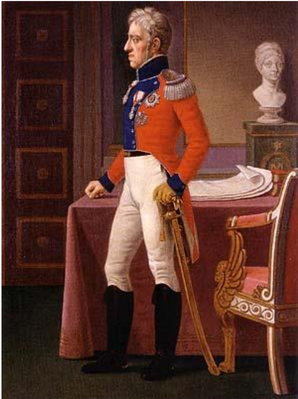
Frederik d. 6.

Ved Wienerkongressen efter Napoleonskrigene havde Frederik d. 6. i 1814 fået lov at beholde Holsten, som den del af det danske monarki på betingelse af, at der oprettedes rådgivende stænderforsamlinger. Nu blev han udefra mindet om dette, og selv om Frederik d. 6. gennem årene var blevet mere og mere centralistisk præget af en "Vi alene vide - politik", så fandt han det klogest at komme en voksende standsbevidsthed i sit folk i møde ved at indføre rådgivende stænderforsamlinger i hele sit rige. Det blev i alt til fire, nemlig i Holsten, Slesvig, Roskilde for øerne og Viborg for Jylland. Hverken fra