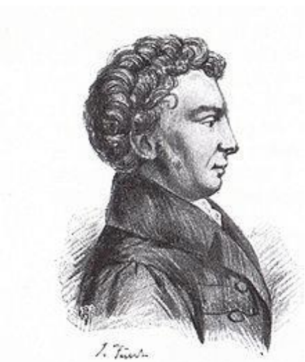
Uwe Jens Lornsen

Jeg tænker på to forhold: Udviklingen i hertugdømmerne, og kongeskiftet efter Christian d. 8's død.